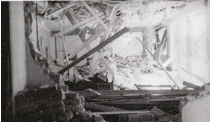
Zerstörung im Thaddäussaal

werden. Anschließend war sogar eine Taufe.