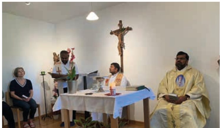
Während des Gottesdienstes