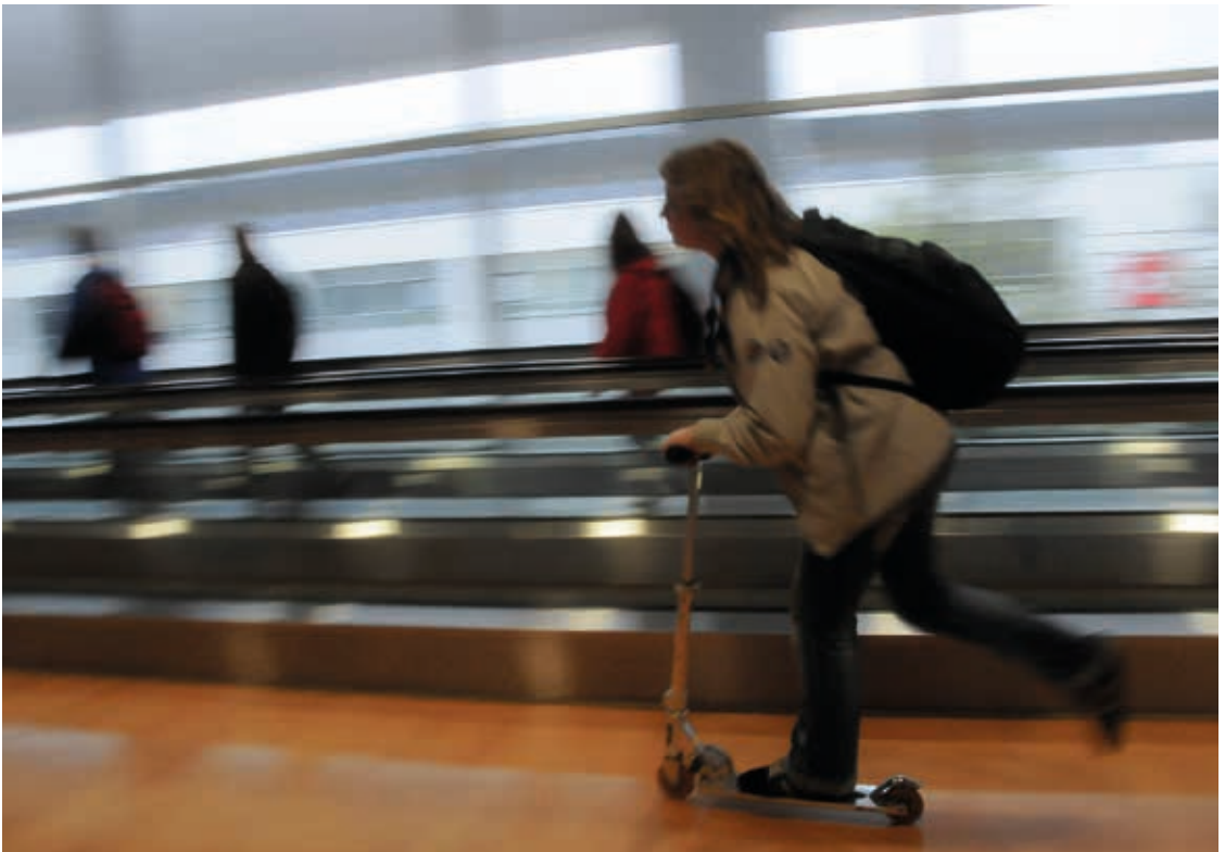
Voll von Stress ...

Arbeit, der Haushalt, Ehrenämter, Hobbys, so viele zusätzliche Termine, teilweise sind auch Feste und Feiern belastend. Es scheint, der Tag ist so vollgepackt mit zu vielen Dingen, sodass man den Überblick verliert und einfach nur noch funktioniert und froh ist, wenn alles geschafft ist. Man ist voll von Arbeit, voll von Stress, voll von Verpflichtungen und Terminen. Auch voll von Gott? An solchen Tagen scheint man von allem zu viel zu haben – und meist zu wenig von Gott. Gerade nach stressigen Tagen denke ich mir: Gott war heute so weit weg für mich. Ich habe