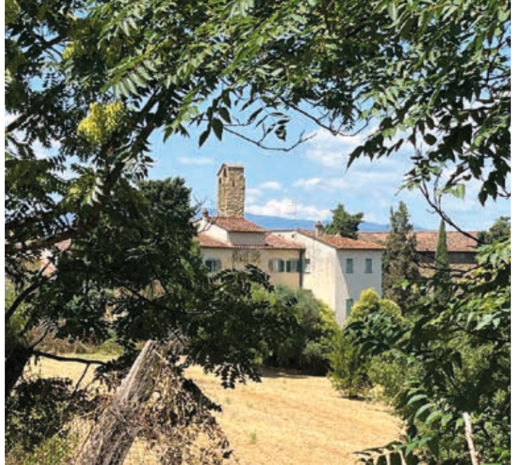
Als Christ in der Welt leben, aber nicht von ihr sein

Schon mit dem Aufkommen der Bettelorden der Franziskaner und Dominikaner und noch mehr mit Beginn der Neuzeit änderte sich diese Vorstellung. So gilt etwa für den Dritten Orden, den weltlichen Zweig der Franziskaner, das Motto: „Unser Kloster ist die Welt.“ Ignatius von Loyola gründete im 16. Jahrhundert die Jesuiten, die ohne Chorgebet leben und