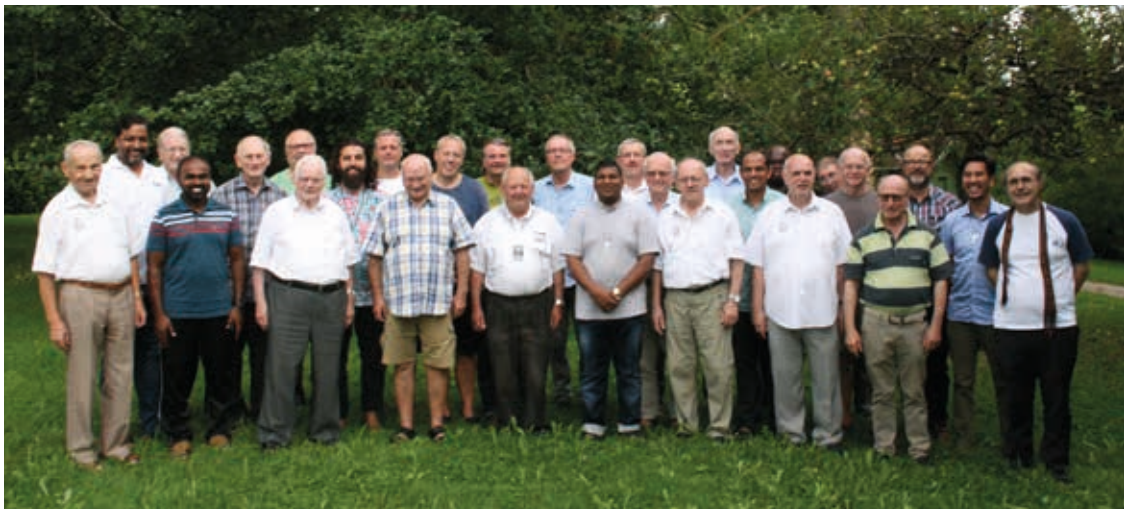
Die Teilnehmer an den geistlichen Tagen

nommen. Es ist sein erster Schritt, die Sales-Oblaten näher kennenzulernen, um sich eventuell dazu zu entscheiden, als Oblate des hl. Franz von Sales zu leben. Diese Aufnahme fand am Freitag, 9. August 2024, im Rahmen einer Vesper statt. ■