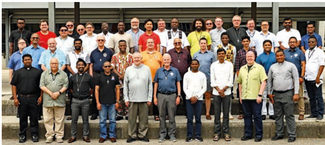
Die Mitglieder des Generalkapitels

Wie Artikel 17 der Konstitutionen uns daran erinnert, wurden wir gegründet, um den Wunsch des heiligen Franz von Sales zu erfüllen, eine Kongregation von Männern zu sein, um sein apostolisches Werk fortzusetzen. Die heilige Johanna Franziska von Chantal hielt diesen Traum nach seinem Tod am Leben. In Treue zu dem Erbe, das wir in unseren Händen halten, wollen wir heute ihre Hartnäckigkeit und Weitsicht feiern.“