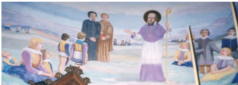
Franz von Sales brachte den Menschen die Liebe Gottes nahe (Gemälde in einer Kapelle in der Nähe von Annecy, Frankreich)

sehen, aber wir alle wissen, sie ist trotzdem da, denn ohne Luft, ohne Sauerstoff könnten wir nicht leben. Sich dieser spürbaren, ja lebensnotwendigen Gegenwart Gottes immer wieder bewusstwerden, diese Übung soll mich über den ganzen Tag begleiten, durch