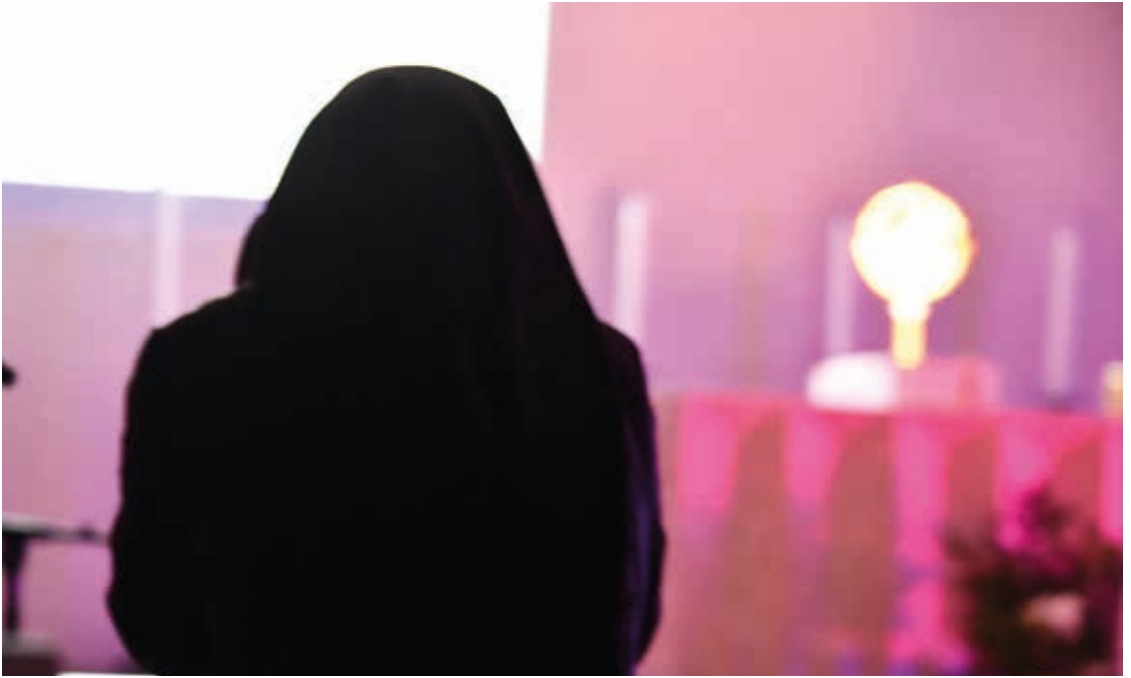
Ihn anzuschauen reicht aus

Tabernakel zu schauen, falls man sich in einer Kirche befindet, ohne fromme Gedanken, ohne mündliche Gebete? Reicht das wirklich? Ja, es reicht aus, es genügt Gott, er ist – menschlich gesprochen - vollkommen damit zufrieden, er verlangt nicht mehr, und ich brauche nicht mehr zu tun.