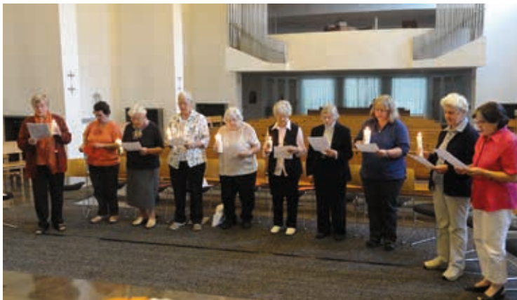
Weihernerneuerung im Bildungshaus Leitershofen bei Augsburg 2012

Für die Gegenwart und Zukunft des Instituts gibt Iria Urnau die folgenden Impulse: „Möge das Jubiläum ein Meilenstein der Freude bei der Betrachtung und Lektüre der Geschichte sein und ein neuer Anstoß zur Ermutigung, nach vorne zu schauen und den Weg fortzusetzen... Ich lese mit Freude und unermüdlich die