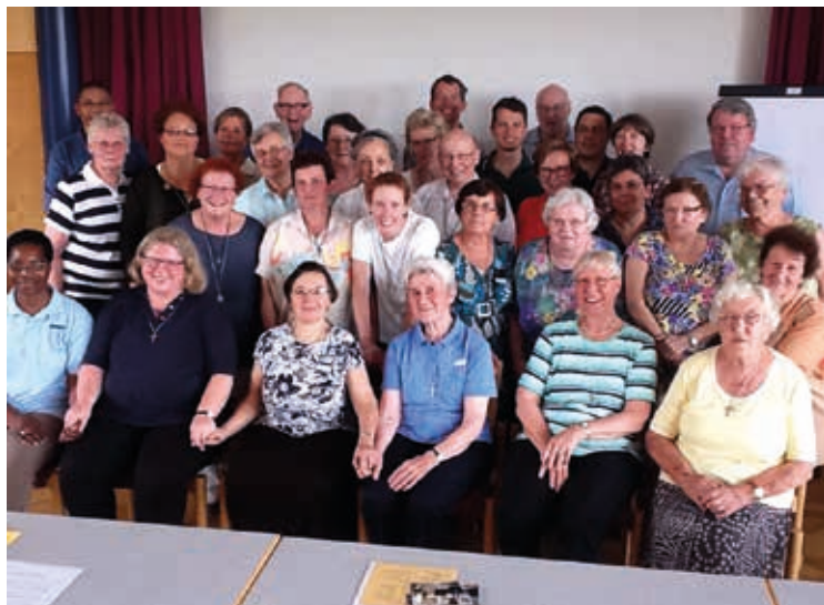
Internationale Gemeinschaft bei der Hauptversammlung 2015

die Gruppe Tübingen geteilt. Ein Jahr begannen in Brasilien die ersten vier Mitglieder ihr Leben im Säkularinstitut, 1975 die ersten Schwestern in Frankreich. Im Jahr 1981 begannen die regelmäßigen Treffen in Nordrhein-Westfalen jeweils in Haus Overbach bei Jülich und im nahegelegenen Linnich-Flossbach, mit vier Mitgliedern und einer Interessentin. 1984 wurde dann die Gruppe Tübingen durch die Errichtung der Gruppe Overbach geteilt. Im gleichen Jahr entstand die Gruppe USA.