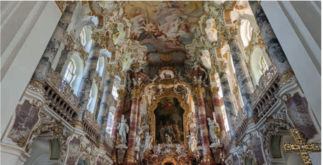
Barockkirchen wie die Wieskirche eröffnen den Blick für Gott, die lebensspendende Sonne