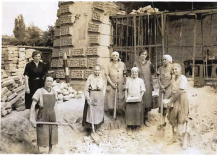
Aufräumungsarbeiten nach Kriegsende (ab Juni 1945)

Die Krim-Kirche wurde zunächst provisorisch aufgebaut. Sogar der Wiener Erzbischof Theodor Kardinal Innitzer half tatkräftig beim Wiederaufbau mit. Bereits Weihnachten 1944 wurde wieder die Christmette in der Kirche gefeiert. ■