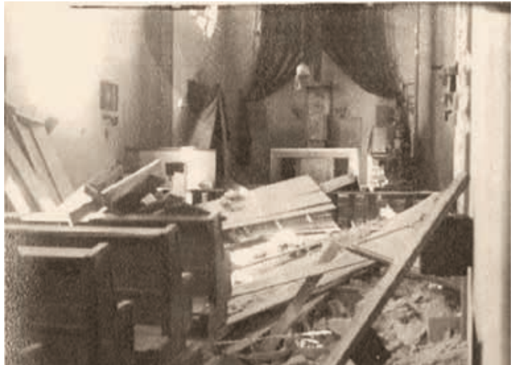
Der zerstörte Kirchenraum: Blick zum Hochaltar

Stunde nachher werden !!! Die Messe ging weiter.